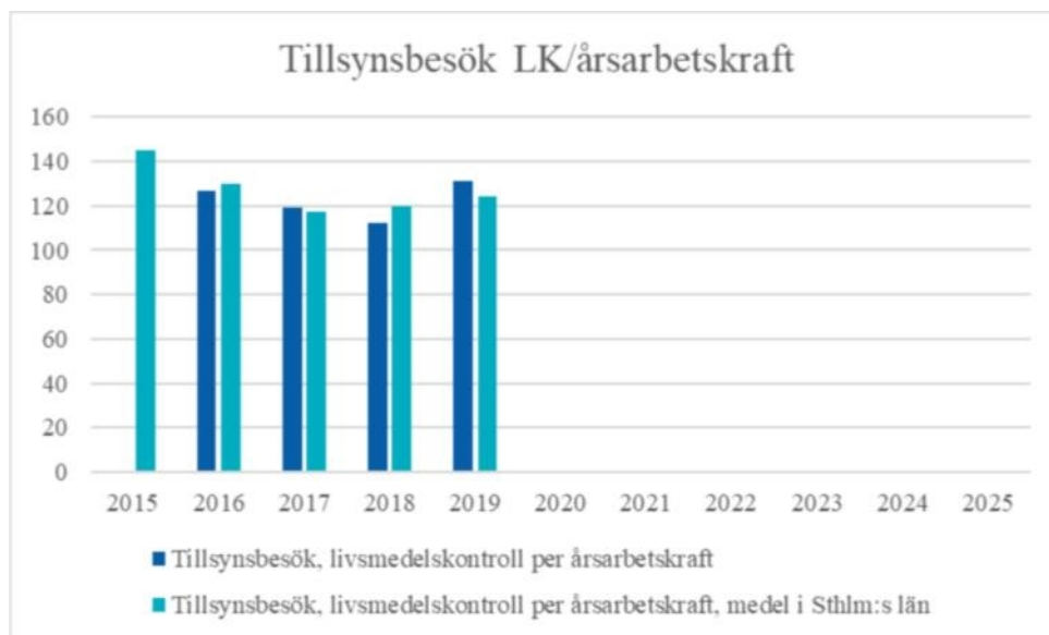
Figur 6. Tillsynsbesök per årsarbetskraft inom livsmedelskontroll, Huddinge jmf snitt för länet.