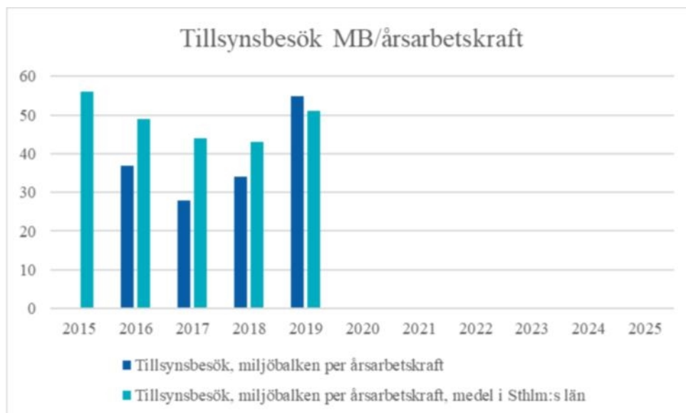
Figur 5. Tillsynsbesök per årsarbetskraft inom miljöbalkstillsyn, Huddinge jmf snitt för länet.

Antalet tillsynsbesök är i snitt för länet 51 besök per årsarbetskraft för miljöbalkstillsyn och 124 kontroller per årsarbetskraft för livsmedelskontroll. Miljöbalkstillsyn spänner över ett betydligt bredare område än livsmedelskontroll och omfattar allt från tillsyn på enskilda cisterner till stora B-verksamheter såsom Scandinavian Biogas eller Stena recyclings verksamheter i Gladö, verksamheter som tar åtskilliga timmar (75 respektive 70) i anspråk varje år. Livsmedelskontroller tar jämförelsevis mindre tid i anspråk varför skillnaderna mellan områdena blir stora i hur många tillsynsbesök som hinns med per årsarbetskraft. I Huddinge genomfördes 2019 55 tillsynsbesök per årsarbetskraft för miljöbalkstillsyn, respektive 131 livsmedelskontroller per årsarbetskraft. I Huddinge genomfördes således något fler tillsynsbesök/kontroller än vad som i snitt var fallet i länet. Jämfört övriga miljöförvaltningar är Huddinges resultat dock nära snittet.