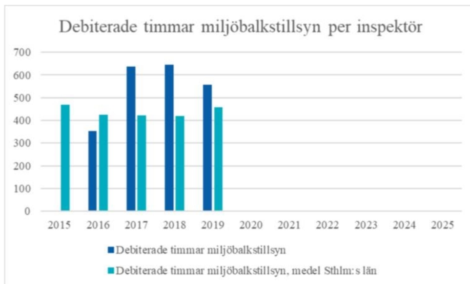
Figur 3. Debiterade timmar för miljöbalkstillsyn, Huddinge jmf snitt för länet.