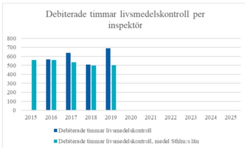
Figur 4. Debiterade timmar för livsmedelskontroll, Huddinge jmf snitt för länet.